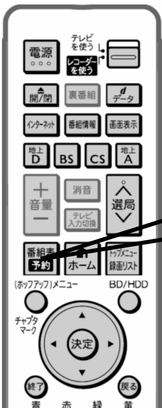
レコーダーのリモコン