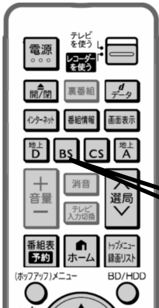
レコーダーのリモコン