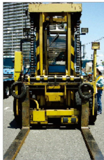
5tフォークリフト前景