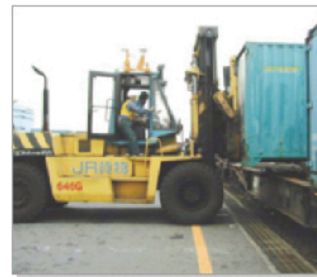
タグ読取のテスト風景