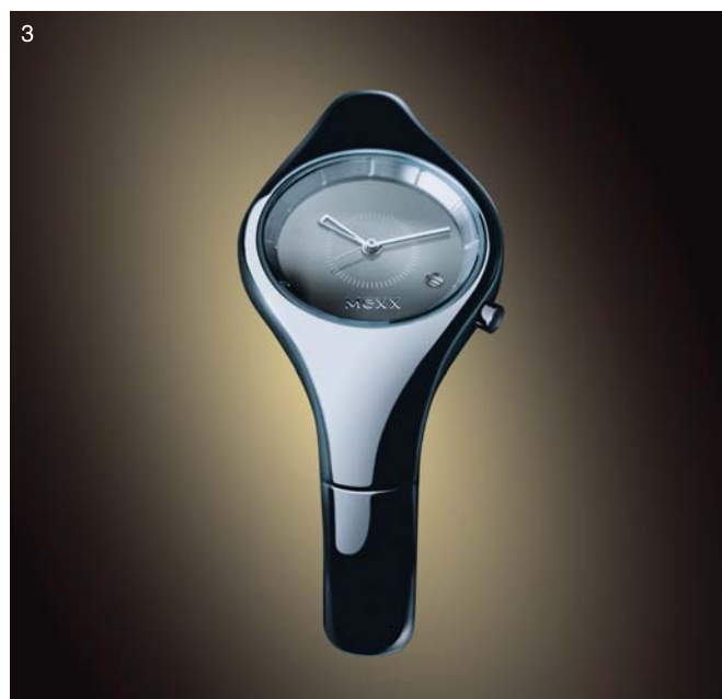
1. TM100(携帯電話) クライアント: シャープ株式会社 2. Talis(携帯電話コンセプトモデル) 3. Passion(腕時計) クライアント: MEXX