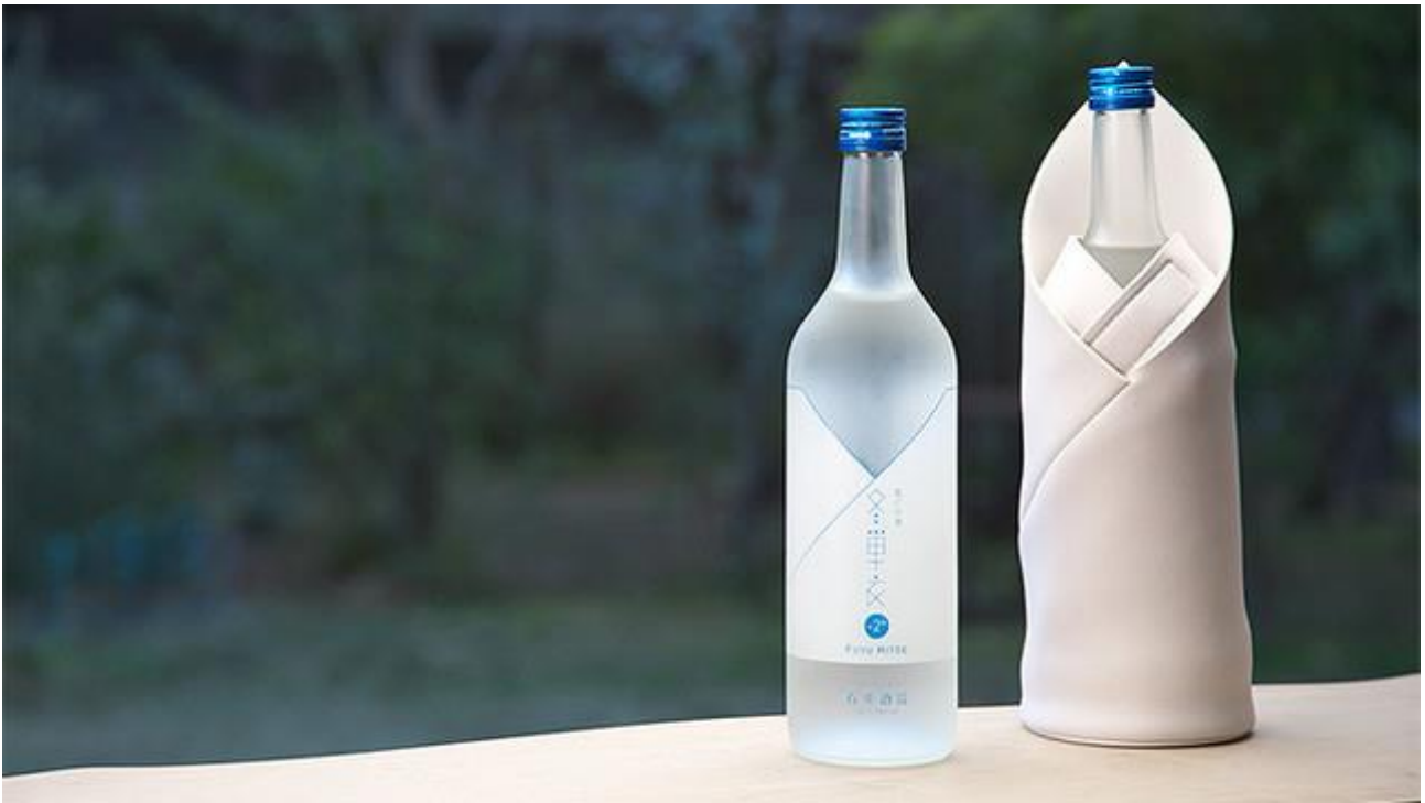
雪どけ酒「冬単衣(ふゆひとえ)」と当社製専用保冷バッグ