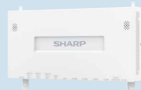
Entry CPU Box RZ-E3618