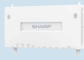
High CPU Box RZ-E3818