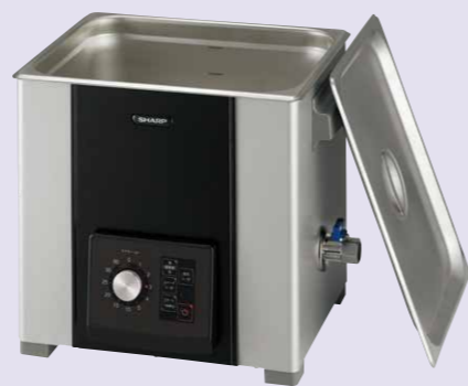
Lタイプ シンプルモデル ヒーター無し