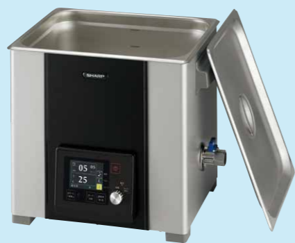
Mタイプ スタンダードモデル 液晶ディスプレイ搭載／ヒーター無し