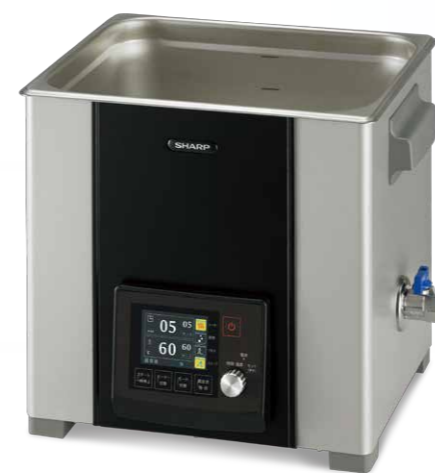
●写真はイメージです。●画面はハメコミ合成です。