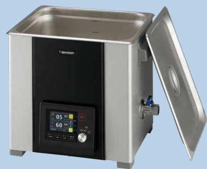
Hタイプ ハイエンドモデル 液晶ディスプレイ搭載／ヒーター有り

ヒーター付きのHタイプ、スタンダードなMタイプ、シンプル機能のLタイプ※1 から選択可能。3タイプ×各6サイズの豊富なバリエーション。 洗浄液の脱気機能に加え、新たな洗浄機能としてスイープモードとパルスモード※2を搭載※3。多彩な洗浄方法を提供します。