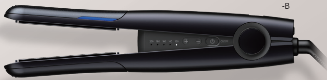
プラズマクラスターストレートアイロン IB-S8000 -B (ブラック系ミッドナイトブラック) オープン価格 -W (ホワイト系リナスホワイト)