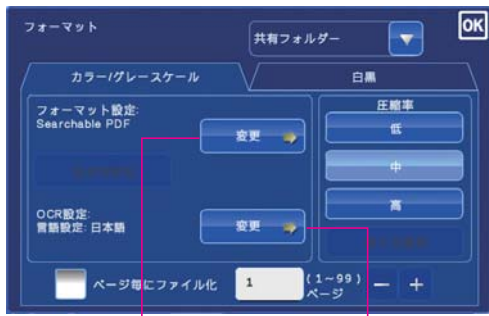
フォーマット設定

変換したいフォーマットや言語の種類を設定するだけでOK。紙の書類のスキャンを開始すれば、お望みのフォーマットに変換し、電子データとして簡単に活用できます。