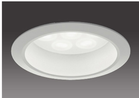
150形 / 半透明パネル