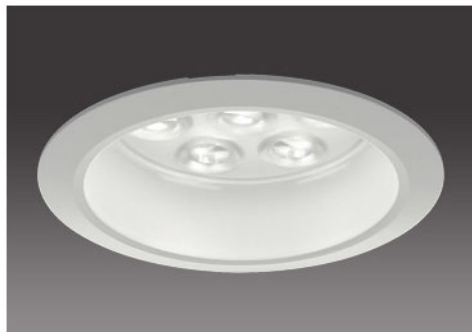
150形/透明パネル(表面シボ加工)