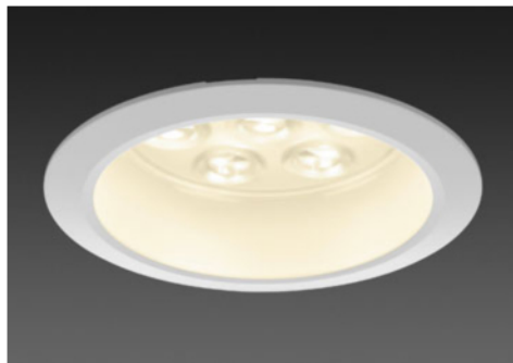
100形 / 透明パネル(表面シボ加工)