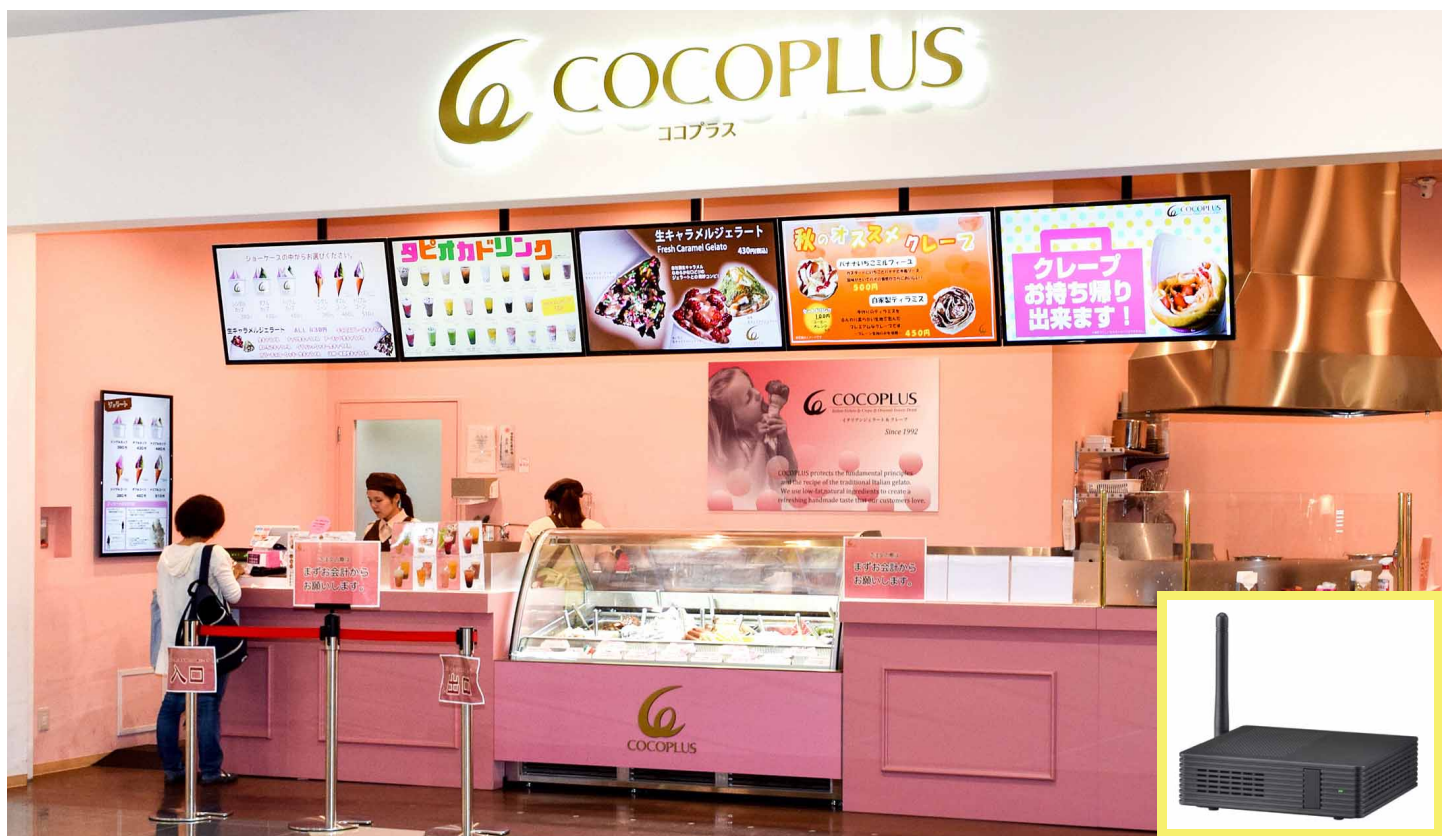
天吊りディスプレイの背面に設置