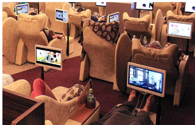
リクライナーの一部にも20台設置