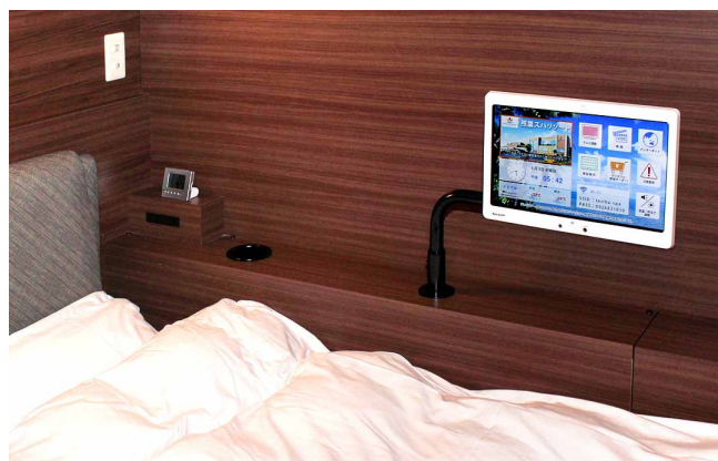
プライベートキャビン(宿泊施設)全46室のベッドサイドに導入

当社で5店舗目の展開となる「照葉スパリゾート」では、女性客を増やすため、美容効果の高い多彩なお風呂や洞窟をモチーフにした岩盤浴、天井に星空が輝く岩盤房など、魅力的な温浴設備を豊富にご用意。一方、ビジネス客の宿泊にもご利用いただけるプライベートキャビンや、お風呂上がりにつつろげるリクライナースペースの設備も一段と充実させ、他店と差別化できる新しいサービスを展開したいと考えていました。