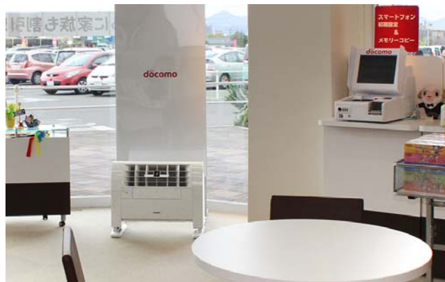
ワイドルーバーの働きで広いスペースに高濃度プラズマクラスターイオンを大量に放出中