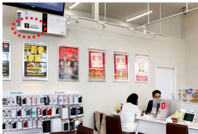
本体にはアイキャッチ効果の高い“空気を浄化中”のステッカー

当店は県下最大級のショッピングモール内にあるため、館内の空調ダクトを通してフードコートなどのニオイなどが店内に漂うこともあり、気になっていました。また、1日平均70組ものお客さまが来店され、しかも入店からお見送りまでの平均滞在時間が1.5～2時間と長時間にわたるため、できるだけキレイで快適な空気環境のもとで接客したいと考え、最適な空調機器を探していました。