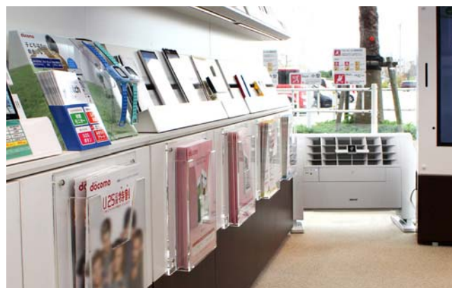
壁掛け型と床置き型の組み合わせで効果的に店内をクリーンアップ