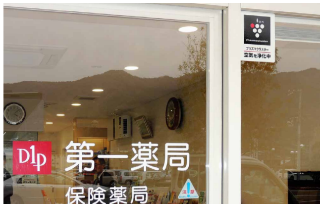
入口にステッカーを貼り設置をPR