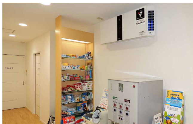
患者さまに風が直接当たらない点も大きなメリット