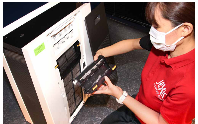
プレフィルター自動掃除で集めたホコリはダストボックスに回収される