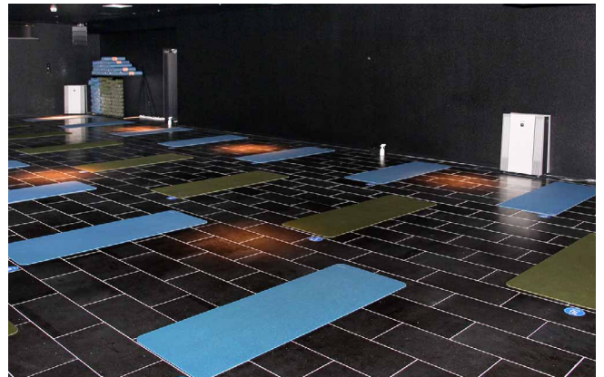
汗をかきやすい岩盤ホットスタジオ内のニオイも大幅に低減