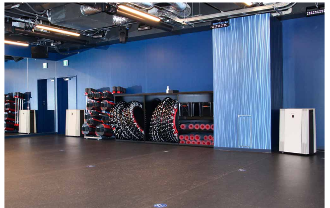
広いスタジオ空間も効果的にカバー

当店での導入効果を受け、新しくオープンした板橋店にも設置しました。今後もお客さまにできるだけ安心して通っていただける環境をつくり、より多くの方にご利用いただき、お客さまの健康と地域の活性化に貢献していきたいと考えています。