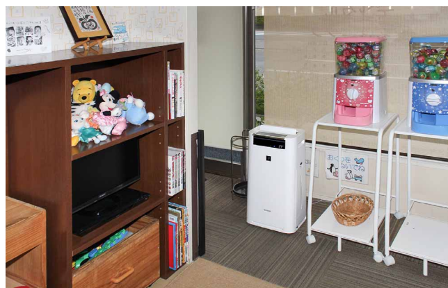
キッズルームには以前から家庭用の加湿空気清浄機を設置