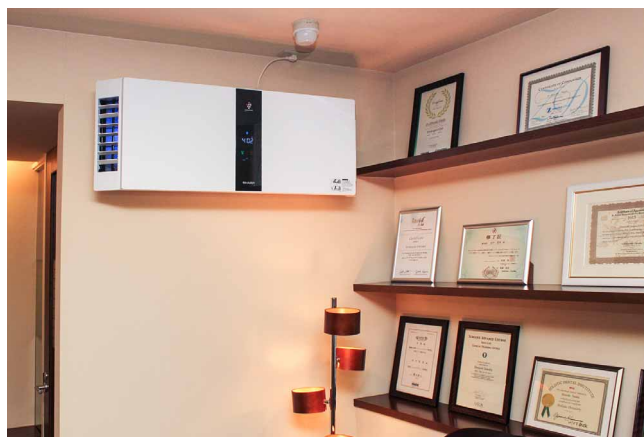
待合室には大型の壁掛け型プラズマクラスター空気清浄機

認知度が高いプラズマクラスターのマークを玄関に貼って、クリーンな空気環境をアピールしていますが、今後は当院のホームページも活用して導入を周知していきたいと考えています。また、プラズマクラスターの導入メリットを実感できたので、次は天井埋込型イオン発生機の追加設置も検討していきます。