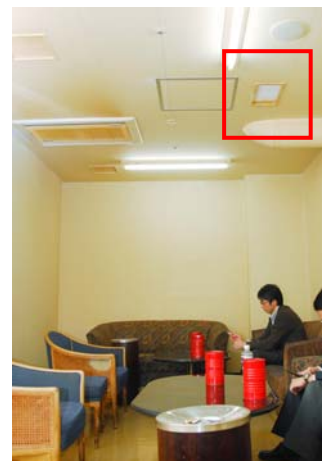
スタッフ用喫煙ルーム

現在は主に客室での試験的な使用となっていますが、次の展開として小宴会場などお客様が密集するスペースへの導入も検討中です。ホテル全体での導入を進めるのと歩調を合わせて、お客様へプラズマクラスターイオンのアナウンスを開始する予定で、これを認知していただくことも、「安心して快適にお過ごしいただけるホテル」というステイタスにつながるものと期待しています。