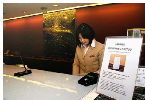
快適に過ごしていただくため、フロントで加湿空気清浄機が客室に設置されていることをご説明