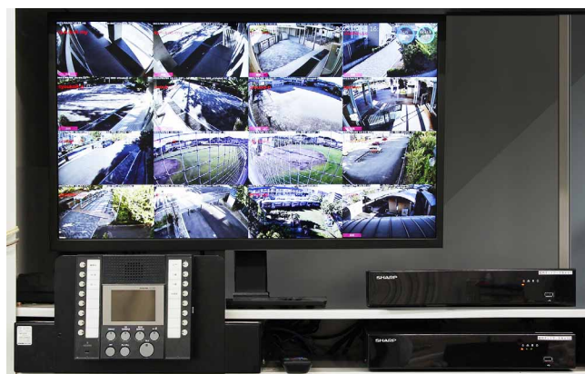
録画と同時に、16画面をリアルタイムで事務室モニターに表示