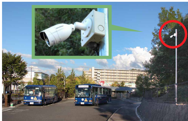
スクールバスの乗降も防犯カメラでしっかり見守り