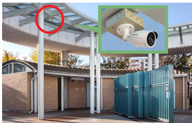
よく目立つバレット型の防犯カメラで外部からの侵入を抑止

故障時には機器交換をしてもらえる5年間のオンサイト保守も活用し、防犯カメラの機能をしっかり維持管理していきたいと思えます。防犯カメラは不審者対応だけでなく、園児児童生徒のトラブルの早期発見・早期対応にも役立つなど、学校生活の安全・安心に寄与します。今後も充実したセキュリティ対策で、一層保護者の皆さまに安心いただける教育環境をめざします。