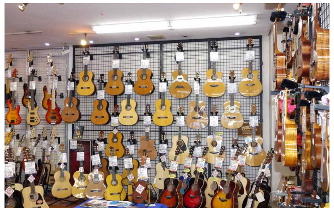
ギターなどの展示楽器の光沢が強調され、お客さまの注目度がアップした1階・楽器売場