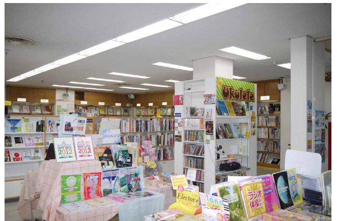
「明るくて音符が見やすくなった」と好評の2階・楽譜売場

現在、2店舗共に事務所などの一部がLED化されていませんが、今後は、ビル全体のオールLED化をめざして導入を進めていきます。また、蔵王店の屋上は南向きで日当たりがよいため、太陽光発電システムの導入も視野に入れており、3年前に導入したプラズマクラスターイオン発生機と共に、快適で環境配慮も行き届いた楽器店として一層の集客を目指します。