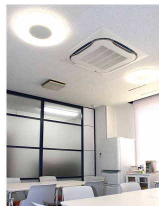
休憩室にはLEDシーリングライト