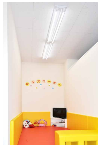
キッズコーナーには直管形を導入