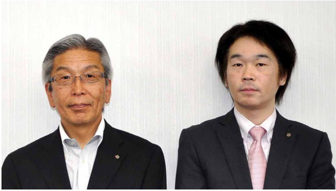
株式会社ハスコムモバイル