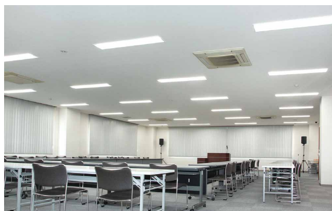
商品展示を兼ねた会議室は埋込型照明ですっきり明るく