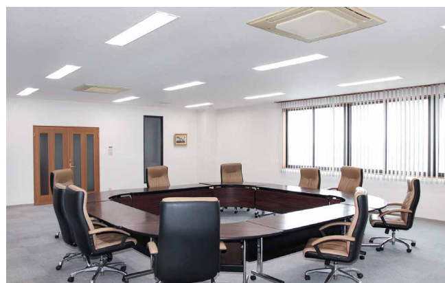
役員会議用のオフィス家具もムラのない明かりでより美しく