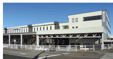
同社・富山センター