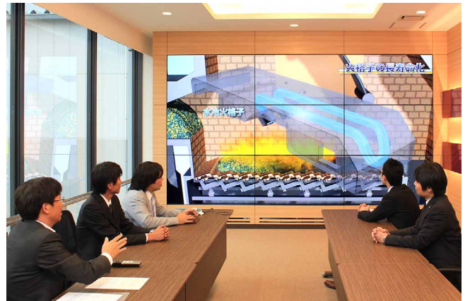
堺事業所・新プラントの各工程を解説する迫力の映像コンテンツ

当社では、産業廃棄物の処理状況を確認していただくため、年間400～500社、2,000名以上のお客様にお越しいただいています。その中でも展望室は商談から適正処理のご提案、処理状況を確認していただく重要施設です。これまでプラントの模型や各種資料を多数用意し、処理工程の説明やデータ公開を行ってきましたが、他社にない方法でお客様に驚きと感動を提供し、当社への理解を深めていただこうと、新プラント竣工に合わせて、大画面による情報発信を計画しました。