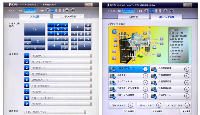
コンテンツの切り替え操作が簡単にできるタブレット端末の画面