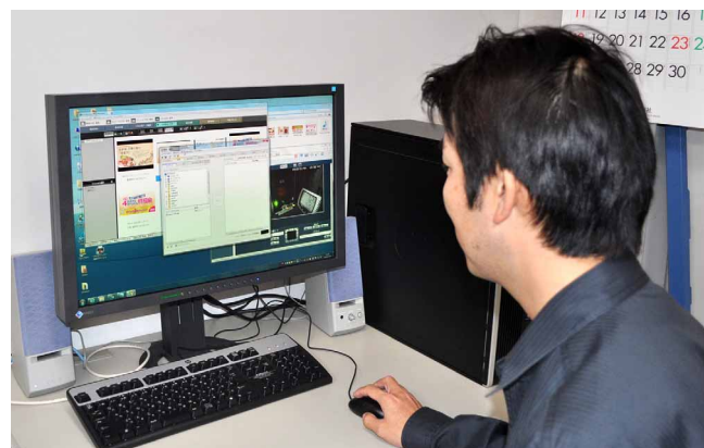
e-Signageは業務の負担にならない操作性が好評