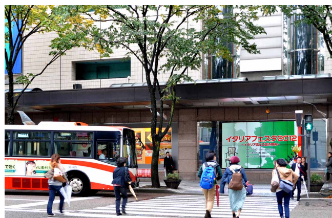
終日通行量の多い横断歩道の正面に設置

コンテンツの中身に関しては、今後、災害速報など市民の生活に役立つ情報をテロップを使って配信することを検討しています。一方、金沢は2015年春開通予定の北陸新幹線により盛り上がりを見せており、当社としては、こうした追い風に乗れ、新施設などへのサイネージ導入を一気に進めていきたいと考えています。