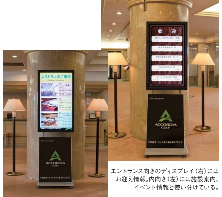
エントランス向きのディスプレイ(右)には お迎え情報。内向き(左)には施設案内、 イベント情報と使い分けている。