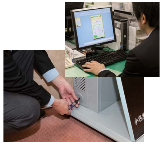
制作したコンテンツはUSBメモリを挿すだけで再生。