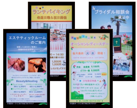
エレベータからフロントへ向かう導線には多彩な情報を用意。