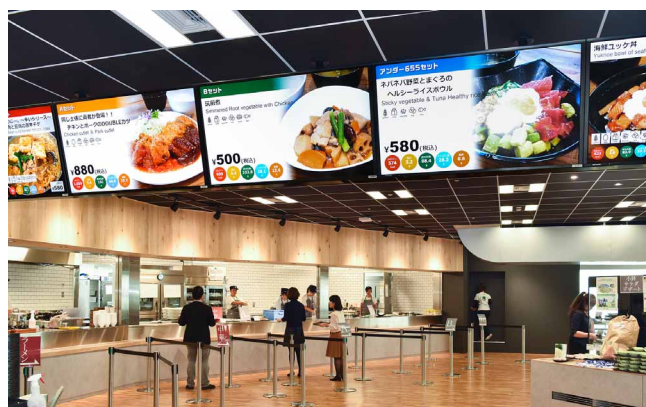
食堂の入口上部にお奨めメニューを写真とともに表示