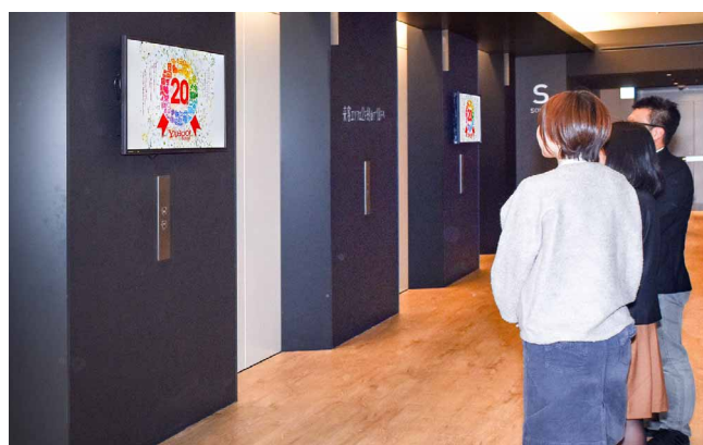
目に留まりやすいエレベーター横に、社内情報を配信