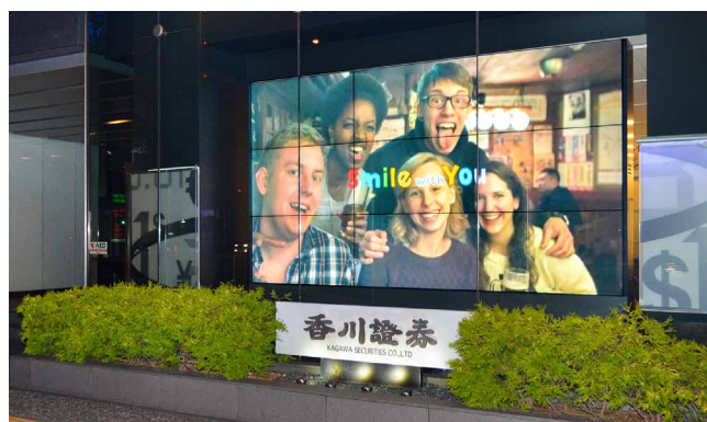
フレーム幅が狭いので、テレビCMを全面面で映す際に継ぎ目が目立ちにくい