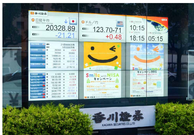
株価や外国為替の情報と合わせて、お奨め商品のPRも

9面マルチの導入に合わせて、同店内や他の支店でもデジタルサイネージやBIG PADを順次導入しており、来店客に市況の情報提供を行ったり、投資セミナーなどでも活用しています。また今後は、地元のニュースを配信したり、自治体と連携してイベント案内や災害時の緊急情報を発信するなど、地域活性化や利便性向上にも役立てていきたいと考えています。