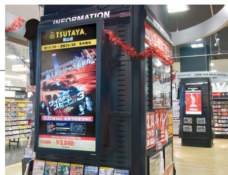
店内の柱に設置された「PN-455R」には、新作の販促ポスターが次々と切り替わって表示されていく。

篠山店では、届いたポスターをデータ化し、インフォメーションディスプレイに表示しています。「スタッフの手間も軽減でき、次々と画面が切り替わることで情報に動きが生まれ、お客様が立ち止まってご覧になる要因にもなっています。また、店内のデザインに統一感が生まれ、すっきりとしたイメージになりました。」