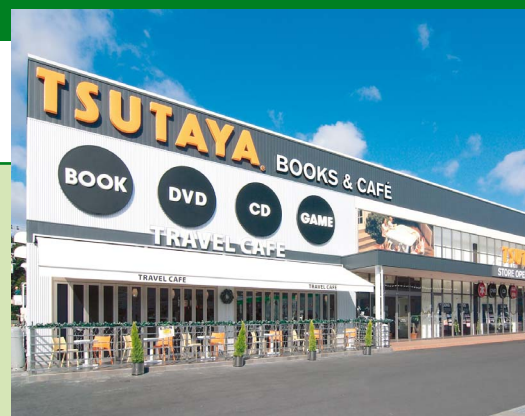
所在地：兵庫県篠山市

大阪市に本社を置き、自動車燃料、灯油、ガスといったエネルギー供給事業に携わっている小浦石油株式会社様。近年は暮らしの総合サービス企業として、多角的に事業を展開されています。そのひとつ、TSUTAYA 事業では、2006年10月にTSUTAYA篠山店をオープン。売場面積約500坪と、TSUTAYAとしては最大級の次世代型店舗として、自然豊かな篠山地区で新たなエンターテインメント空間を提供されています。