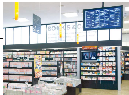
天井から吊り下げられた「PN-455R」。ショップに入っすぐの書籍コーナーに設置されており、この「PN-455R」に会員特典やレンタル料金を表示することで、CDやDVDのレンタルコーナーへと誘う。

れ、タイトルにタッチすることで映像や詳細が表示される。そして、QRコードなどを使って予約。そうするとカウンター業務も簡略化でき、お客様も大画面を見ながらじっくりと作品を選べるようになります。リニューアルを控えた既存店もあり、篠山店での成功をいかして、インフォメーションディスプレイを導入していきたいと思っています。」