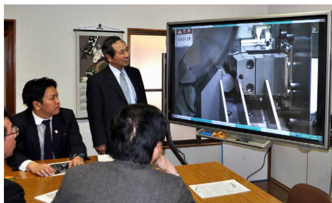
動画が格段に見やすくなったと好評