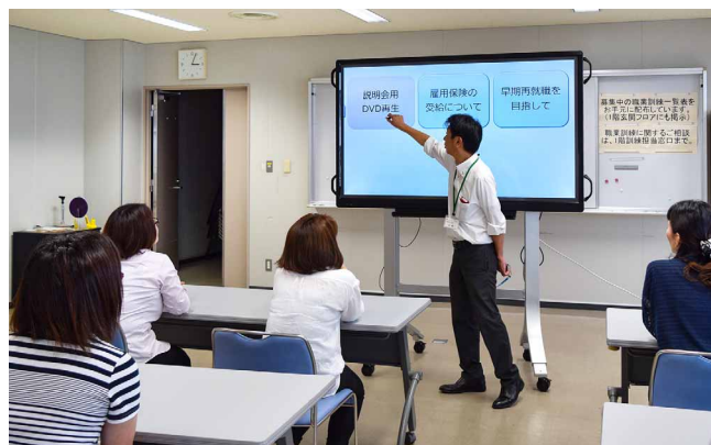
シャープのプレゼン支援アプリ「雇用保険説明会支援システム」の採用により、動画再生・資料表示をワンタッチで切り替え

今後は雇用保険説明会だけでなく、職業訓練説明会でも使用し、利用者サービスのさらなる向上につなげていきたいと考えています。このほか、当ハローワークの職員向けの研修会でも使用していくなど、BIG PADを幅広く活用していきたいと考えています。