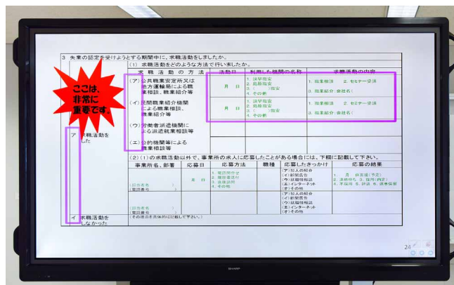
注意点に赤枠をつけたり、文字解説を加えて理解を促進