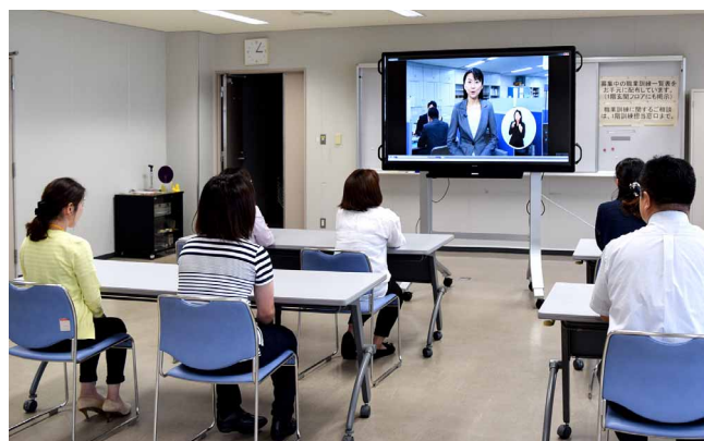
動画再生もBIG PADで行い、説明会の進行を1台に集約